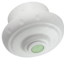
LEGIO.ball Kartuschenset mit antibakt. Strahlreglereinsatz