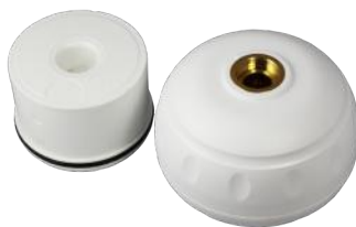
LEGIO.ball Startset mit antibakt. Strahlreglereinsatz