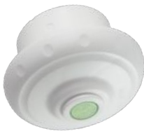
LEGIO.ball Kartuschenset mit antibakt. Strahlreglereinsatz