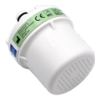
LEGIO.mini shower m