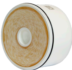
LEGIO FML ICF Wechselkartusche