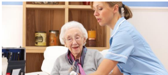
Домове за възрастни хора/Рехабилитационни центрове