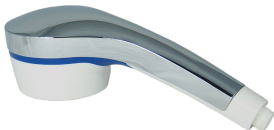
LEGIO.premium shower Душ филтър