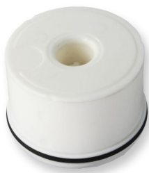
Сменяем мембранен картридж LEGIO