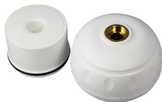
LEGIO.ball Waschtisch Startset mit antimikrobiellem Strahlreglereinsatz