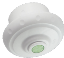
LEGIO.ball Kartuschenset mit antimikrobiellem Strahlreglereinsatz